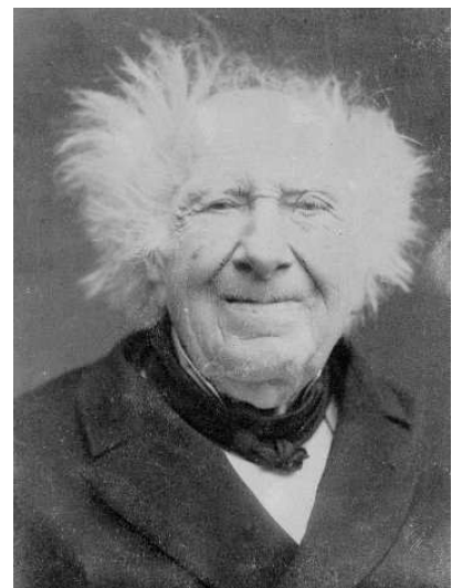
Petit Papounet papy rh précurseur en tout

Alors la médecine du travail, toujours pas scientifique ?